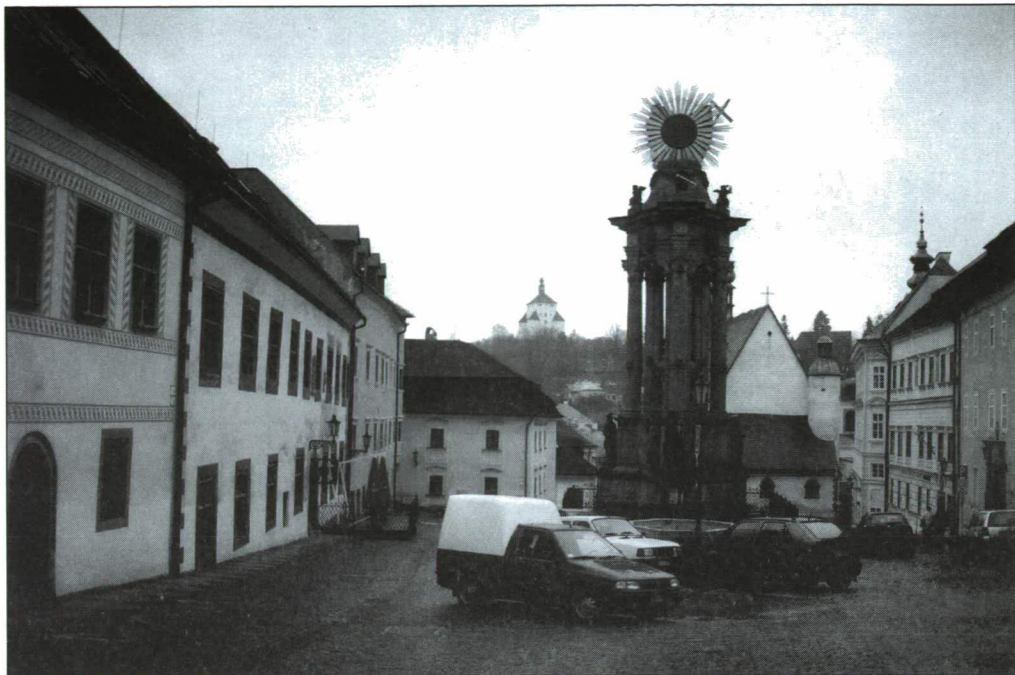
Selmechánya polgárai a pestistől való megmenekülésükben hálaából emelték a Szentháromságot ábrázoló emlélművet.

Azt mondják, szinte minden magyar település elmondhatja magáról: Nálunk is megfordult Petőfi! (A költő nevét bátran behelyettesíthetjük Kossuthéra vagy Széchenyiére.) Íme egy romos épület, melyben a jeles költő ugyan-csak diákoskodott kis ideig.