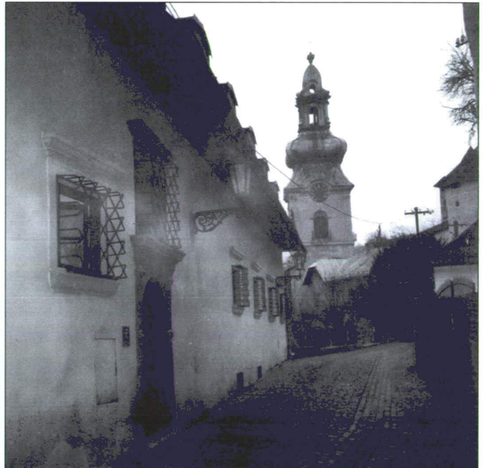
A „jó Selmec” síkatorai a középkor hangulatába vezetnek vissza.