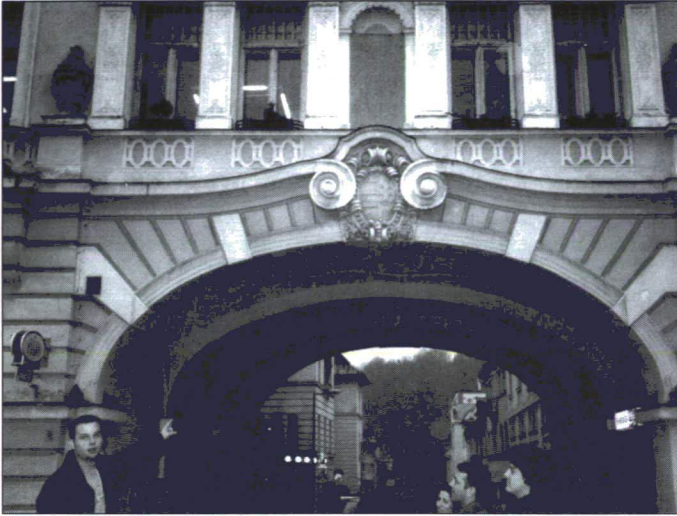
Nini! A barokk kapu címere a büszke múltat idézi!