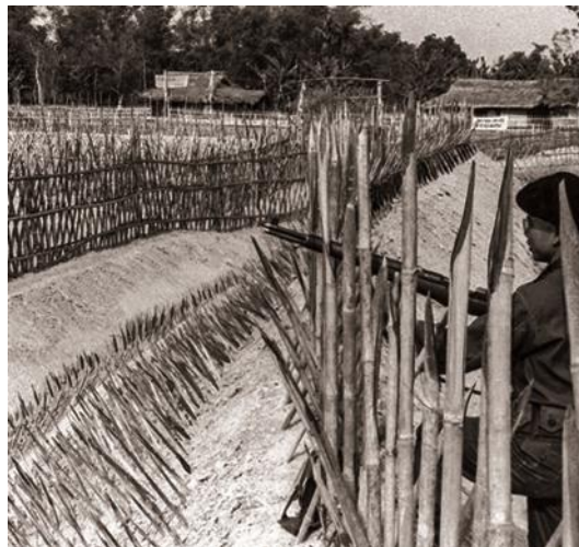
4. kép: Egy stratégiai falu