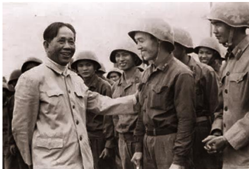
3. kép: Le Duan a gerillái körében