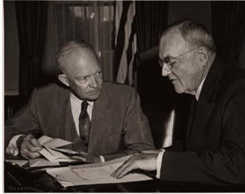
2. kép: Dwight D. Eisenhower elnök és külügyminisztere, John Foster Dulles