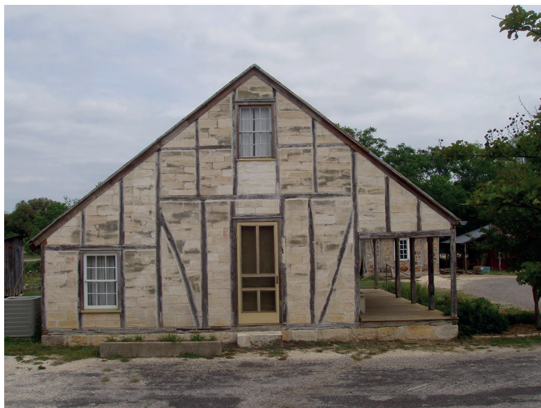
1. kép: Fachwerk stílusban épült lakóház New Braunfelsben