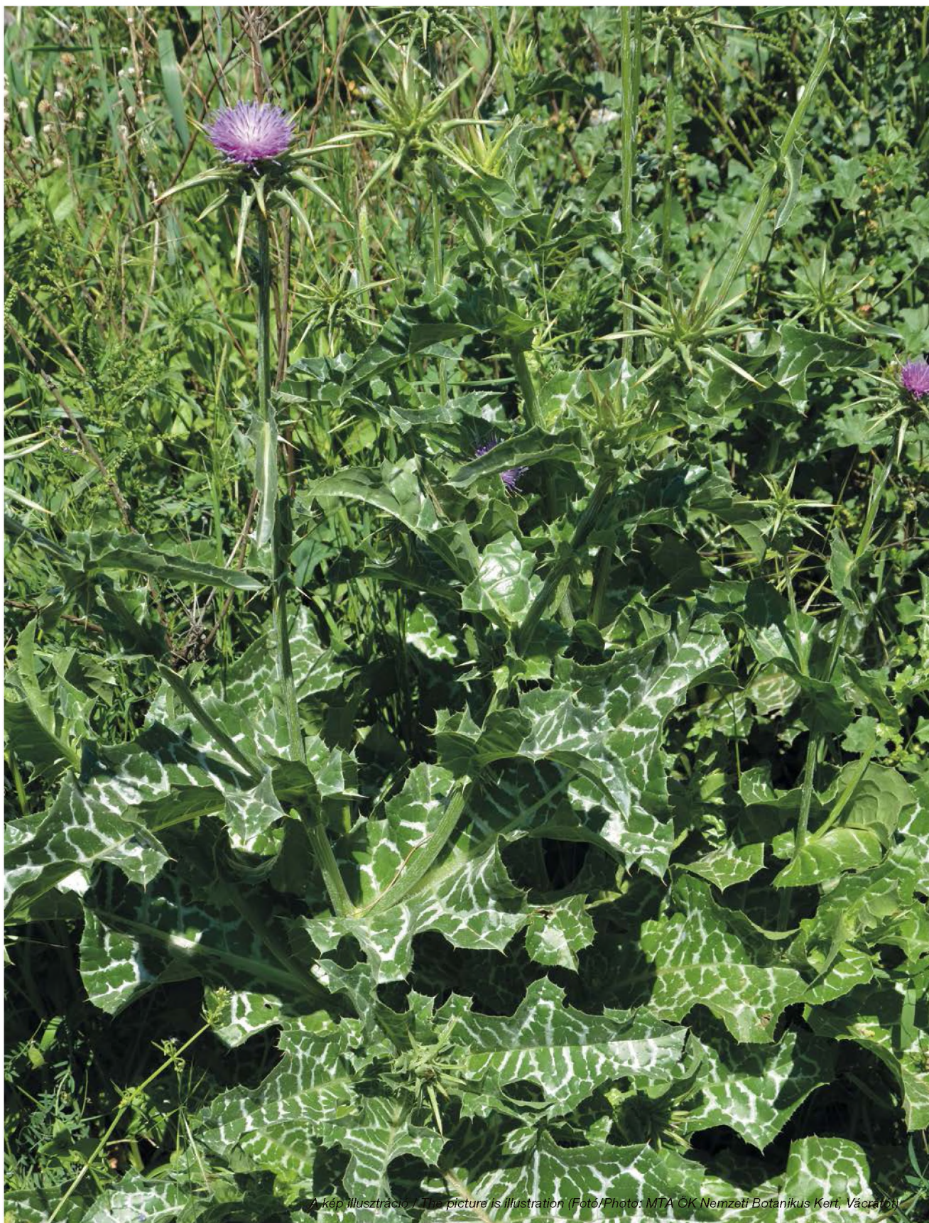
A kép illusztráció / The picture is illustration

During our further work, dissolutions of the individual flavonoid compounds will be investigated in a targeted way, using coupled analytical methods (e.g., HPLC/MS).