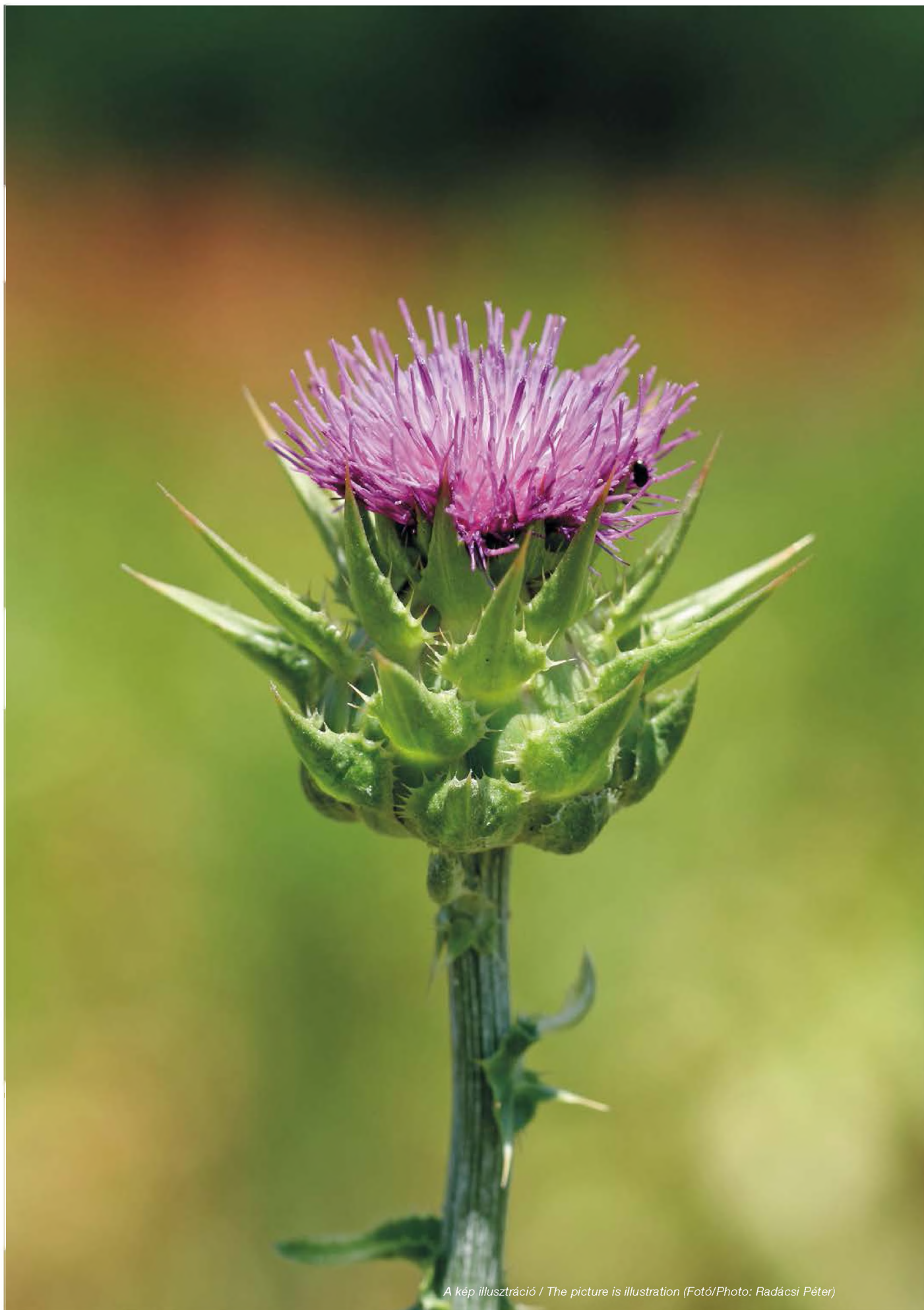
A kép illusztráció / The picture is illustration