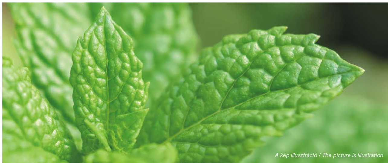
A kép illusztráció / The picture is illustration

A teakeverék és drogjainak az összes flavonoid-tartalmát két különböző gyógyszerkönyvi módszerrel mértük le. Az eredményeket az 1. táblázat tartalmazza.