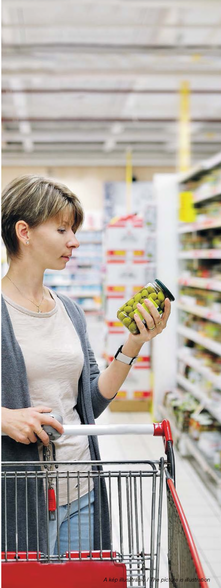
A kép illusztráció / The picture is illustration