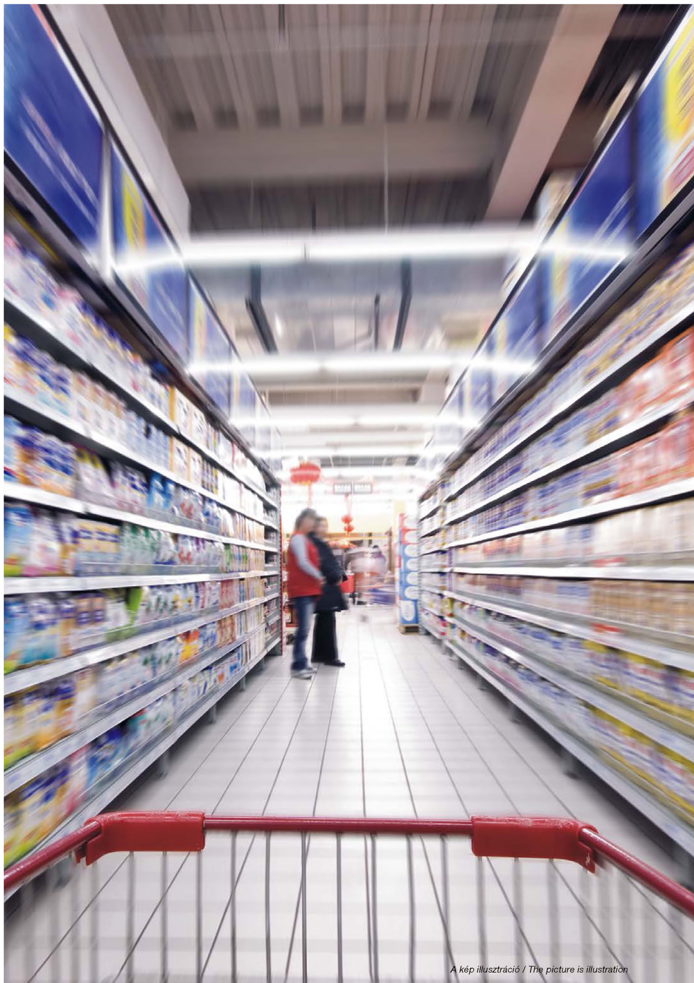
A kép illusztráció / The picture is illustration