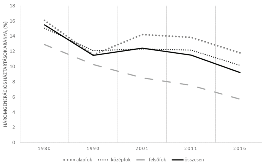
2. ábra. Háromgenerációs háztartások aránya a szülők (középső generáció) iskolai végzettsége szerint

A multigenerációs háztartások előfordulása nem független a benne élő felnőttek társadalmi státuszától. Ha a társadalmi státuszt az iskolai végzettséggel közelítjük, akkor azt tapasztaljuk, hogy a felsőfokú végzettségű szülők körében lényegesen alacsonyabb ennek az együttélési formának az előfordulása, mint a nem diplomások körében. A társadalmi távolságok pedig időben növekedtek, nem csak a diplomások és a nem diplomások között, hanem a középfokú és az alacsonyabb végzettségűek között is. (2. ábra) Ebből arra lehet következtetni, hogy a három generációs együttélési forma időben nézve egyre inkább összekapcsolódott az alacsonyabb társadalmi státusszal. Ez alapján feltételezhetjük, hogy a multigenerációs együttélési forma létrejöttének egyik legfontosabb oka az maga a szegénység lehet. A diverzifikáció folyamata az 1990-es években indult, amikor jól láthatóvá vált, hogy miközben a diplomások körében tovább folytatódott a háromgenerációs háztartások arányának csökkenése, addig a középfokúak körében enyhe, az alacsonyabb végzettségűek körében pedig kifejezetten erős növekedés történt. (2. ábra)