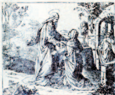
56. Mária kőfogóssa Erzsébet asszonyul.

19-ik számú képes melléklet a VERSES SZENTIRASHOZ.