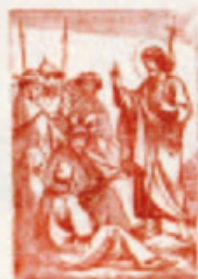
61. Herodeszék serege Jézus születését a templomban.