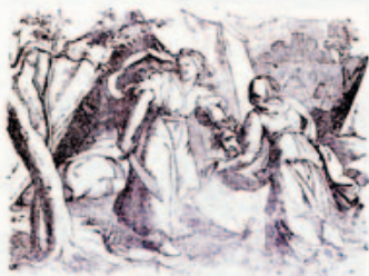
44. István levágya a Hölötemes fejét.