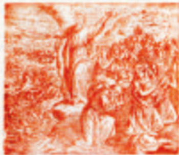
23. Á. pártok illiktek a Szentírásnak.