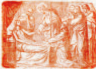
26. Jézus elhelyezve a sírba.