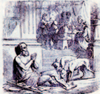
29. A dögörög és a nyomorult Lázár.