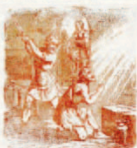
71. A feltámadás után Jézus feltámad.