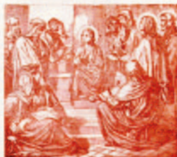
60. A kisded Jézus bemutatása a templomban.