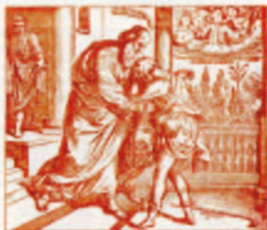
72. A feltámadás után Jézus felmegy az égbe.