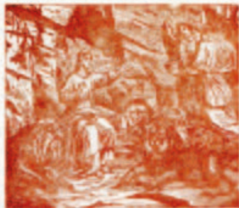
47. István István előtt az ország az országos király.