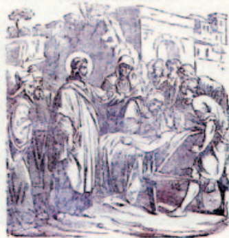
70. Jézus a tanítványait felkészíti.