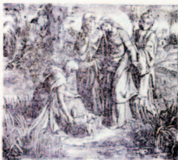
20. Mózes megtalálta a síst körül.