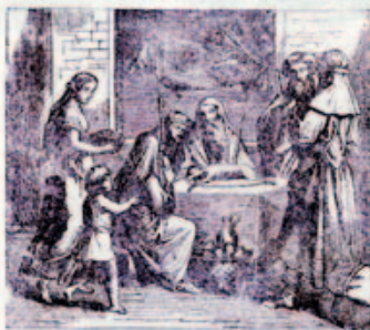
22. A lusselli látny.

Minden jó keresztlény háznál legyen egy Bilia v. Szentírás. Közzel az Egri Nyoma Részvénytársaságnál, Egriben.