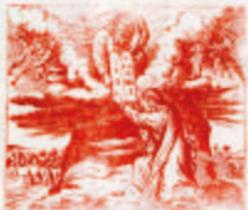
25. Mózes a szentírásról szóló beszéd.

Minden jó keresztlény háznál legyen egy Bilia v. Szentírás. Közzel az Egri Nyoma Részvénytársaságnál, Egriben.