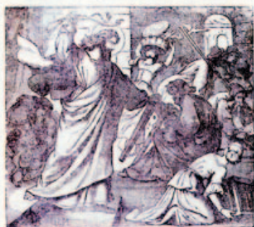
68. Jézus megtisztítja a templomot.