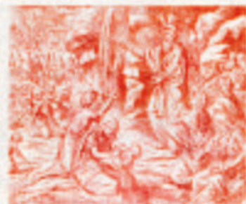
24. Mózes a szentírásról szóló beszéd.