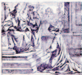
45. Eszter a király előtt.