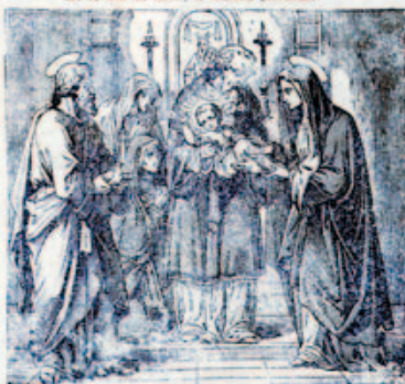
58. Simeon karjába veszi a kisded Jézust.

20-ik számú képes melléklet a VERSES SZENTIRASHOZ.