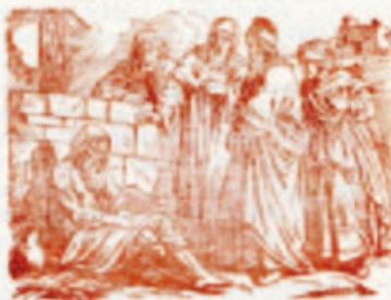
49. A Szent Szent Szent.

Kiadó: Egri Nyomda Reszvénytársaság, Egerben.