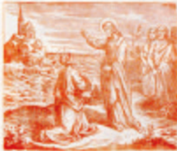
27. Jézus felkelt az apostolok előtt.

A Teremtés kezdete óta az emberiségnek az Istennek köszönhetően van élet, és az emberiségnek az Istennek köszönhetően van élet.