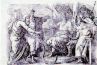
21. Áron botja kígyóvá változik.