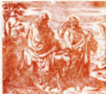
59. A kisded Jézus bemutatása.

20-ik számú képes melléklet a VERSES SZENTIRASHOZ.