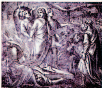
46. A három fiatal ember megmenekülése az égő kemencéből.

A Verses Szentírás és sok százelel más ajafos könyvek, füzetek és imádságok az Egri Nyomda Reszvénytársaságnál (Egerben, Gimnázium-utca 3. sz.) rendelhetők meg.