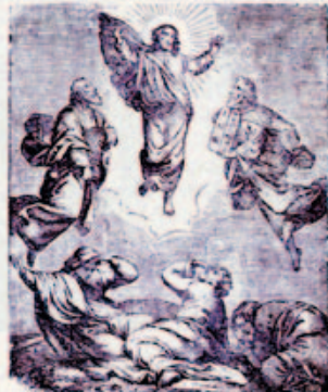
30. Jézus a Tábor-hegyen.