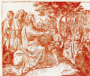
73. Jézus megjelöl a Szent Lélekkel az apostolusokat.