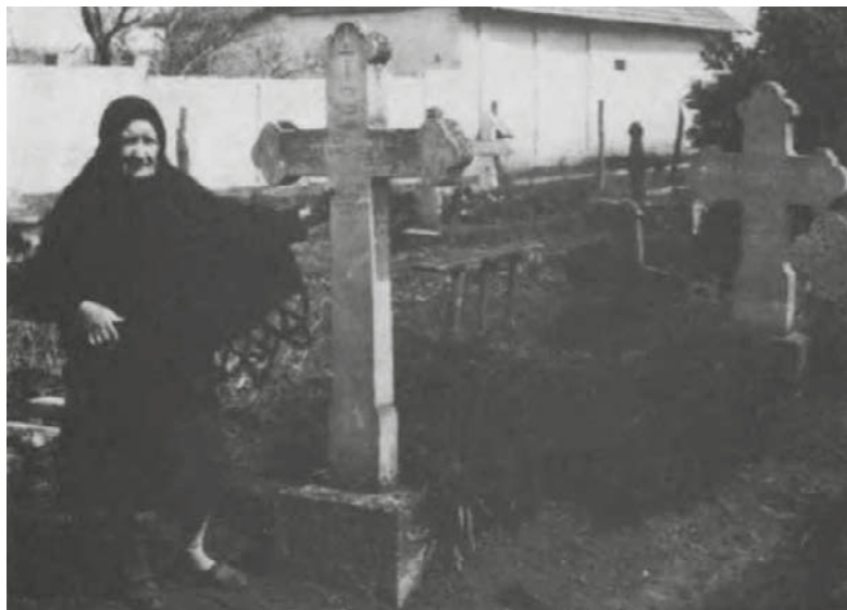
2. kép Mészáros Mihály sírja a csépai temetőben. 1977.