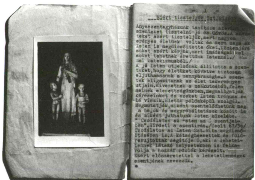
Imafüzet beragasztott szentképpel