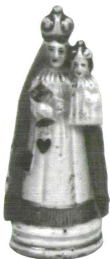
Mária a gyermek Jézussal, festett porcelán szobor