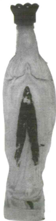
Lourdes-i Mária alakját formáló szenteltvíz tartó