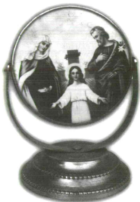
Kegytárgy két, forgatható képpel